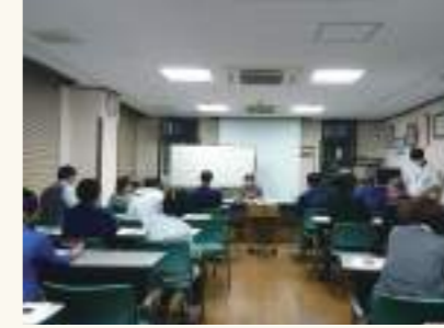
定期的に研修を開催し、サービスの質の向上に努めています。