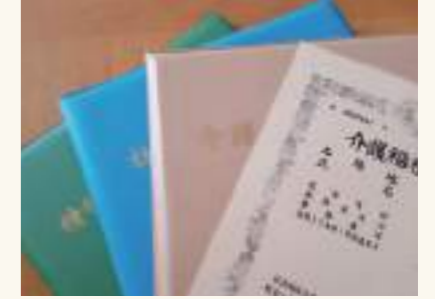
法人で介護職員実務者研修を開催するなど資格取得を後押ししています。