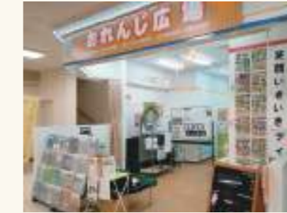
介護・保育相談、就職相談、健康体験などができる場所を、大型スーパー内に出店しています。