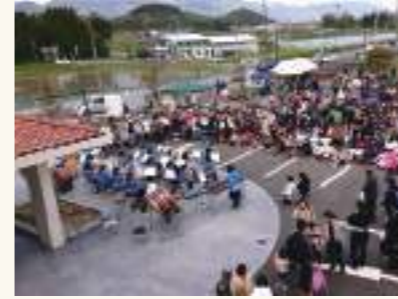
施設と地域のつながりを大切に、地域イベントに協力、参画しています。