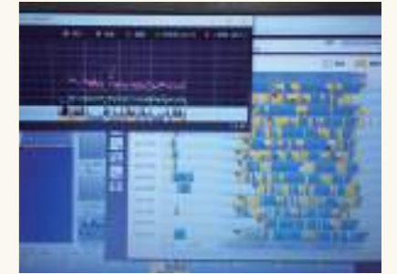
アナログのあたたかい支援にテクノロジーを融合した支援を行っています。(写真は睡眠時センサー)