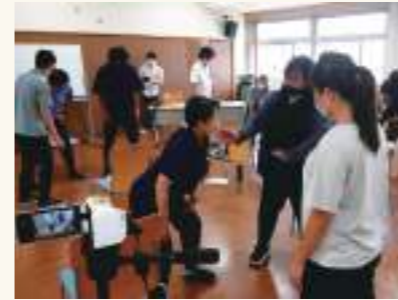
大学から講師を招いたり、反対に小学校などへ講師に伺ったりと、産学関係を意識した交流を行っています。