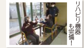
リハビリ機器も完備!

コグニバイクって? 頭を使う課題をしつつ同時に身体を動かす事のできる機器です。脳と身体機能アップ! 認知症予防につながります。