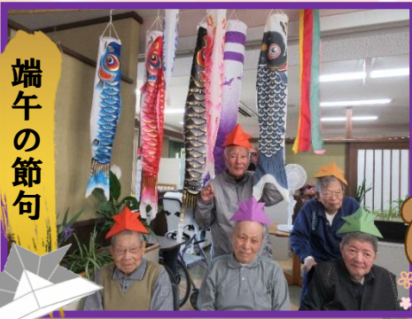
男の子の成長を祝う日なので記念撮影(笑) 昔は、新聞紙で兜を作って遊びましたね。 覚えてますか?