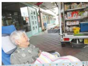
移動スーパーとくし丸