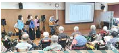
メイツ歌・漫談ボランティア