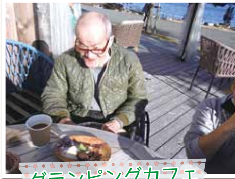
グランピングカフェ