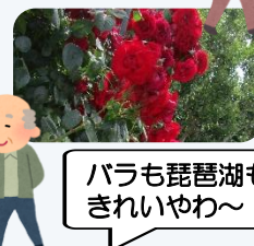
バラも琵琶湖も きれいやわ〜